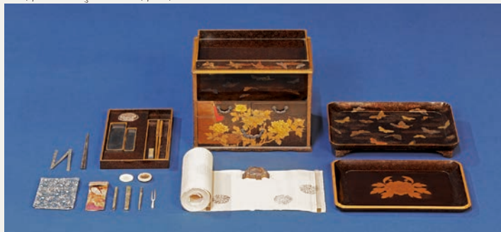
पोटैबल स्टेशनरी सेट जुन माकी-इ टेकनीकमा सुन र चाँदीको लेपद्वारा पुतली र फुल बनाइएको छ