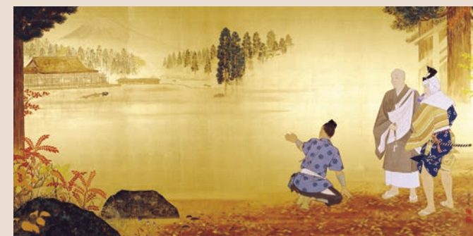
ताइसेकीजी स्थापनाको तश्विर