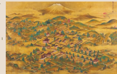
सुरुका क्षेत्रमा अवस्थित फुजी ताइसेकीजीको मानचित्र एदोकालको उत्तरार्ध