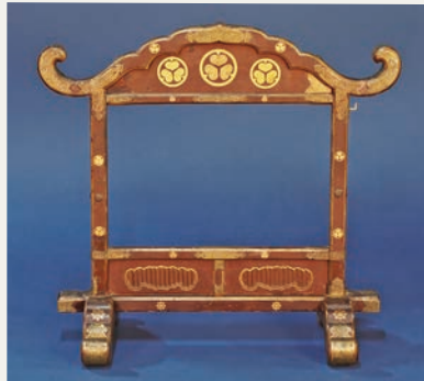
केइ लाई फुण्डाएर राख्ने स्ट्यान, केइ धातुबाट निर्मित ध्वनि साधन हो जसमा हौलिकक अकीत तोकुवावा सोगुनाते परिवार को सिम्बोल लाइ माकीइए टेकनिकमा सुनको लेपलगाइएको छ