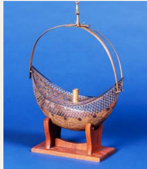
डुहा आकारको तामाको फुलदानी जसमा सुनको जलप लगाइएको छ