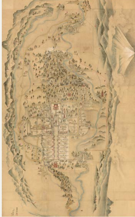
『ताइसेकीजी परिसर मानचित्र』 एशो कालखण्डमा कानो स्युसेन द्वारा चित्रीत