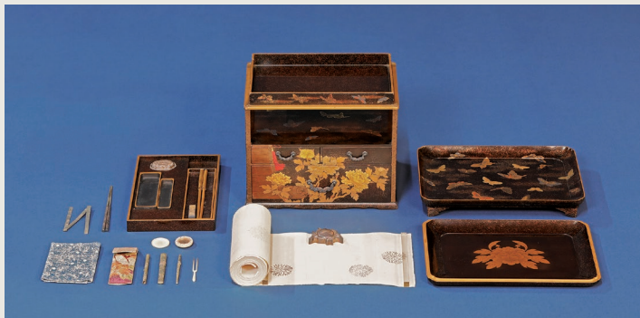
蝶牡丹蒔繪道中小形文具