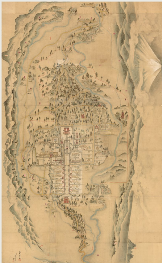
『大石寺境内圖』江戸時代中期 狩野舟川畫