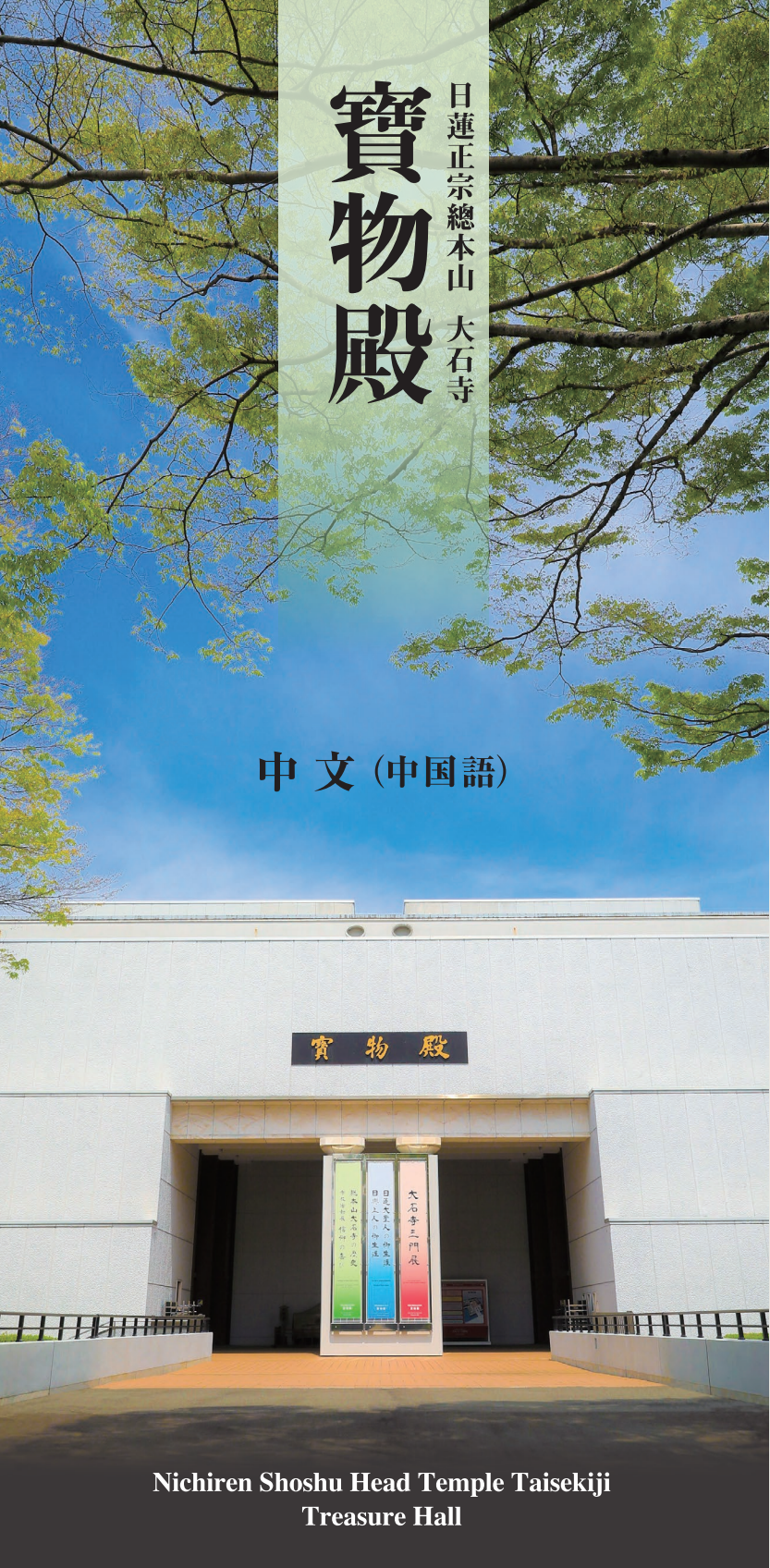
Nichiren Shoshu Head Temple Taiseikiji Treasure Hall