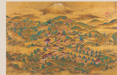
駿州富士大石寺之圖 江戸時代後期