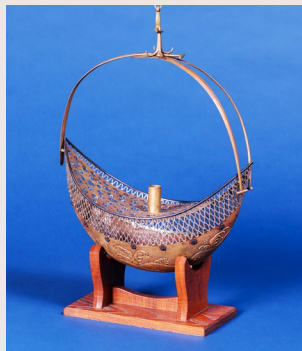
銅板鍍金透彫船形釣花器